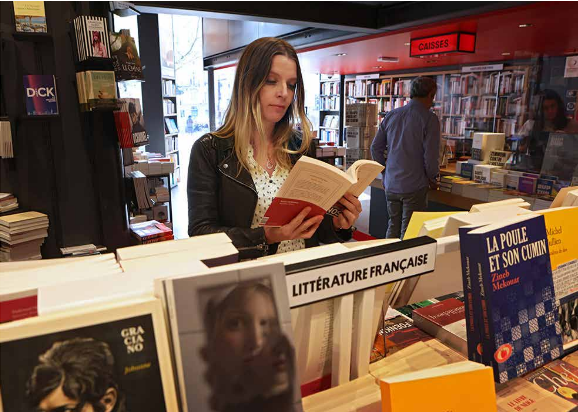
Bokhandeln Librairie Gallimard får regelbundet finbesök.

–Frankrike är regerande mästare men får det nog svårt. Italien vann EM senast men är ju inte med så det