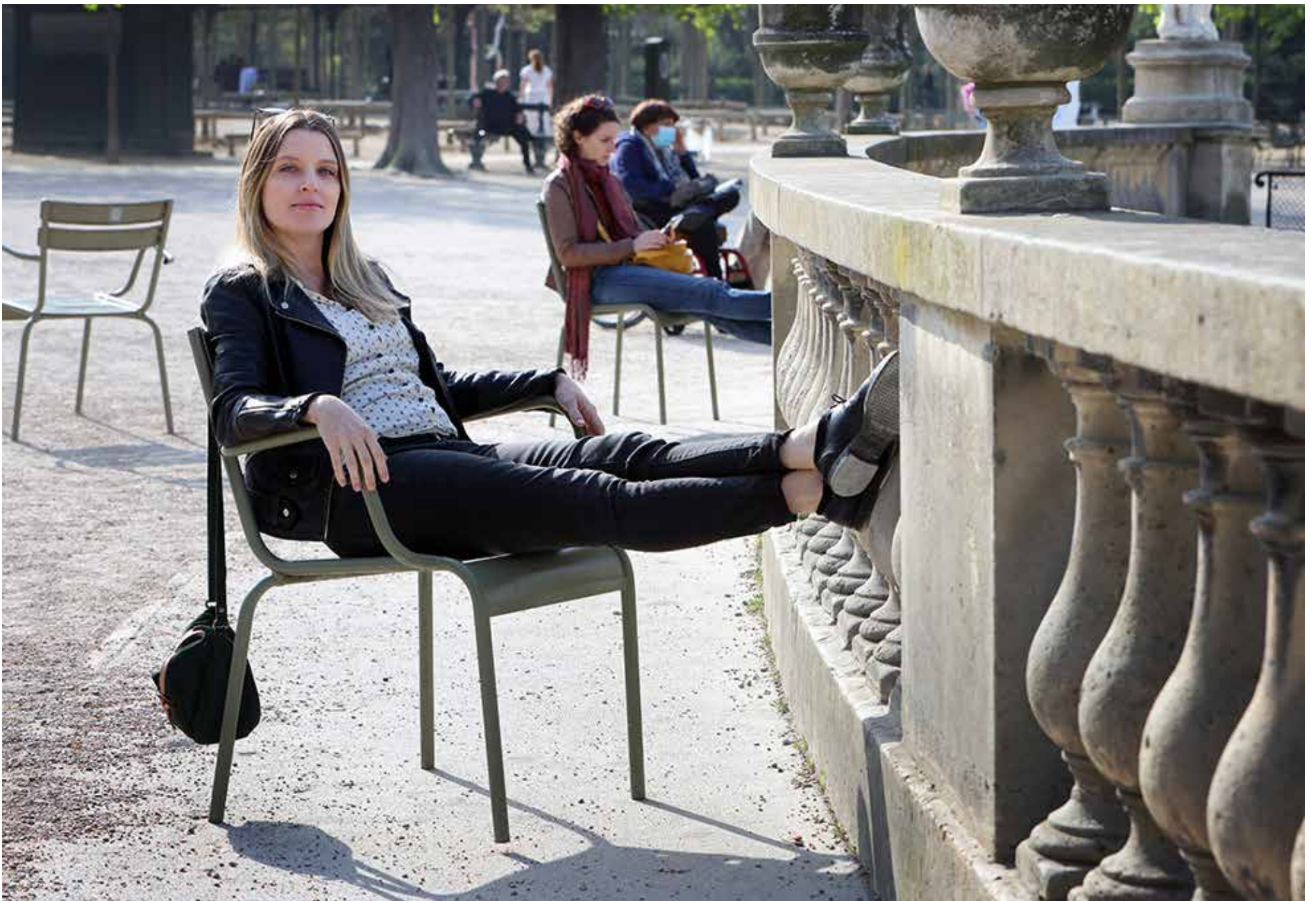
Att lapa vårsol i Luxemburgträdgården ger ny kraft åt intellektuella sportjournalister.

missa den svenska cupfinalen på Tele 2 på söndan. Det finns plats för diverse förseningar.